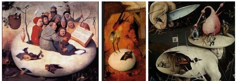
Jérôme Bosch , Le concert dans l'œuf ; détail de La Tentation ; détail de l'Enfer du " Jardin des délices "

Zohreh Zavareh évoque Jérôme Bosch, l'artiste de la Renaissance aux peintures effrayantes représentant le Paradis et l'Enfer. Le forumillement de détail à découvrir l'inspire dans son travail.