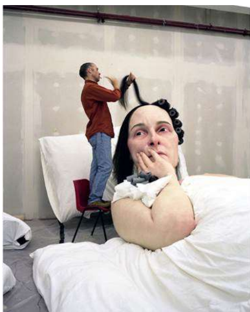
Ron Mueck travaillant sur In bed 2005 (hyperréalisme)