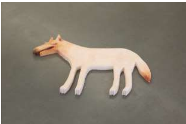
Le nommé chien plat, 2020 Silicone, polystyrène, pigments 110 x 70 x 5 cm

Le chien plat est pour ainsi dire l'acteur principal des deux dernières expositions de Zohreh Zavareh. Sa particularité est d'être posé sur le sol au milieu de l'espace comme au beau milieu d'une route. Il nous signale que rien ne presse, qu'être couché n'a rien de contrariant, car si on ne le voit pas tout de suite, on ne peut que gentiment buter dessus. Son allure de figure de cartoon égarée le rend troublant et sympathique. Il fait partie d'une confrérie de sculptures-personnages (...). CB