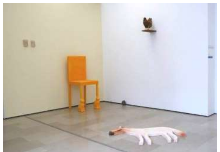
Installation au salon de Montrouge, en 2019