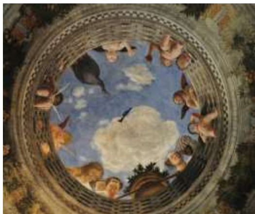
Oculus château Saint Georges (XIVe) Mantoue, Lombardie, Italie

Le réalisme est un mouvement artistique apparu en France et en Grande-Bretagne au milieu du XIX e siècle, qui, affirmant sa différence quant au romantisme, se caractérise par une quête du réel, une représentation brute de la vie quotidienne et l'exploration de thèmes sociétaux. Le réalisme n'est pas une tentative d'imitation servile du réel, et ne se limite pas à la peinture.)