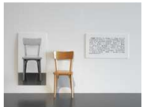
Joseph Kosuth (1945 - ) One and Three Chairs (Une et trois chaises) 1965 Bois, tirages photographiques

Exemple : Chaise en bois, photographie de la chaise et agrandissement photographique de la définition du mot "chaise" dans le dictionnaire