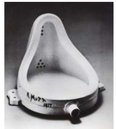
Marcel Duchamp Fontaine

Un ready-made est un objet manufacturé qu'un artiste s'approprie tel quel, en le privant de sa fonction utilitaire. Il lui ajoute un titre, une date, éventuellement une inscription et opère sur lui une manipulation en général sommaire (retournement, suspension, fixation au sol ou au mur, etc.), avant de le présenter dans un lieu culturel où le statut d'œuvre d'art lui est alors conféré. Deux bons exemples en sont La Roue de bicyclette de Marcel Duchamp et La Tête de taureau de Pablo Picasso. Réutilisé dans le mouvement américain du Pop Art.