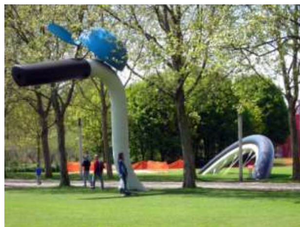
Claes Oldenburg La Bicyclette ensevelie Parc de la Villette - Paris 1990 (Pop art)