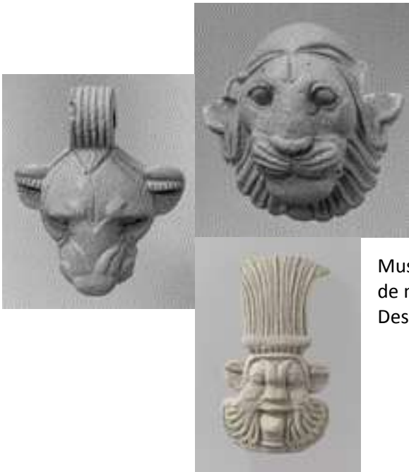
Amulettes iraniennes. Musée du Louvre

Vêtements - textiles iraniens, costumes traditionnels