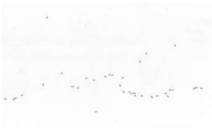
Dessin à l'encre : Zohreh Zavareh

Disciplines : Arts plastiques, Histoire de l'art, Poésie, Littérature, Théâtre