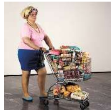
Duane Hanson Supermarket Shopper 1970

L' hyperréalisme est un mouvement artistique du dernier quart du XX e siècle consistant en la reproduction à l'identique d'une image en peinture ou en sculpture, tellement réaliste que le spectateur vient à se demander si la nature de l'œuvre artistique est une peinture ou une photographie.